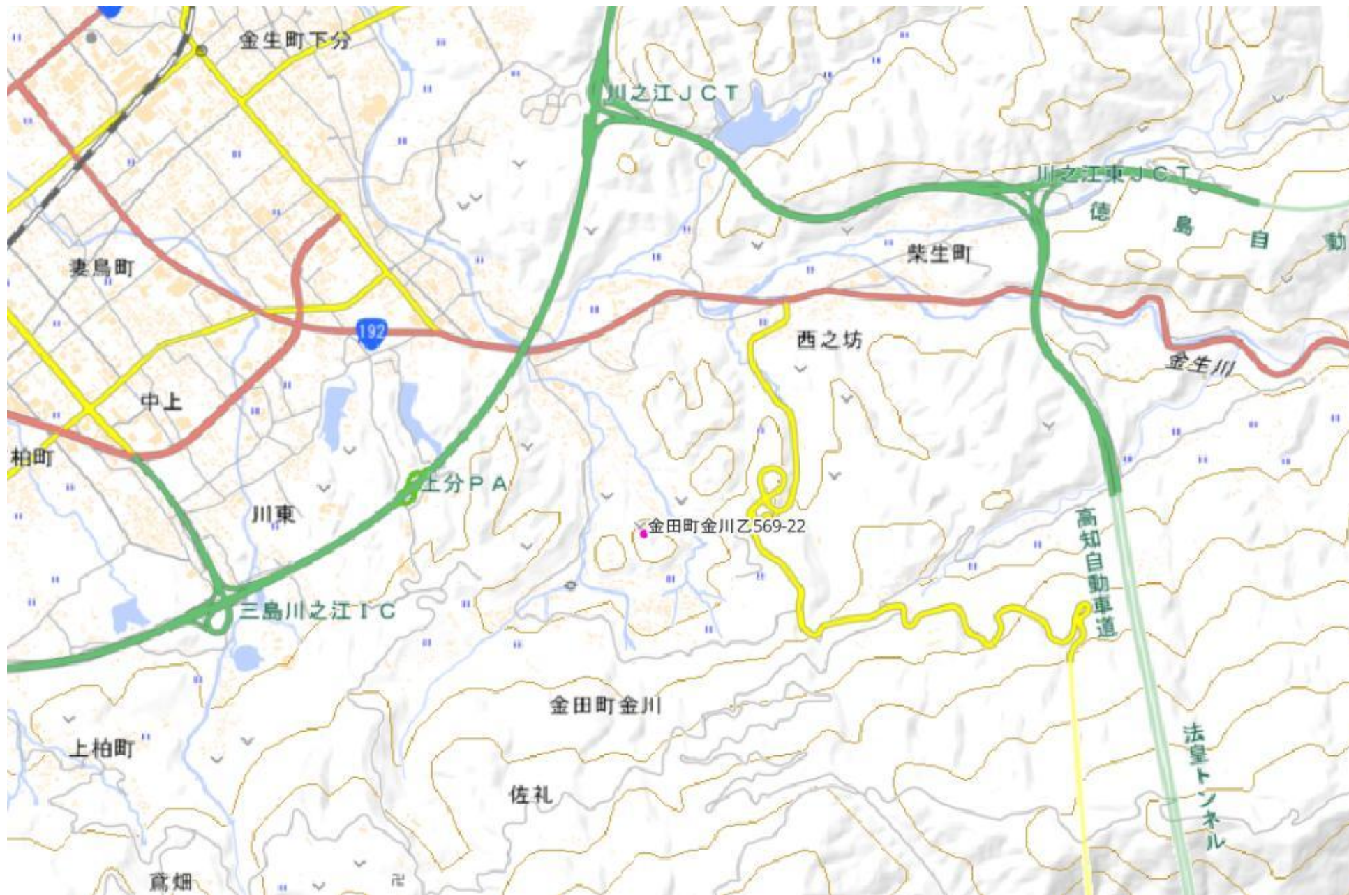
甲が経営管理を委託する意思を表示した森林の広域図