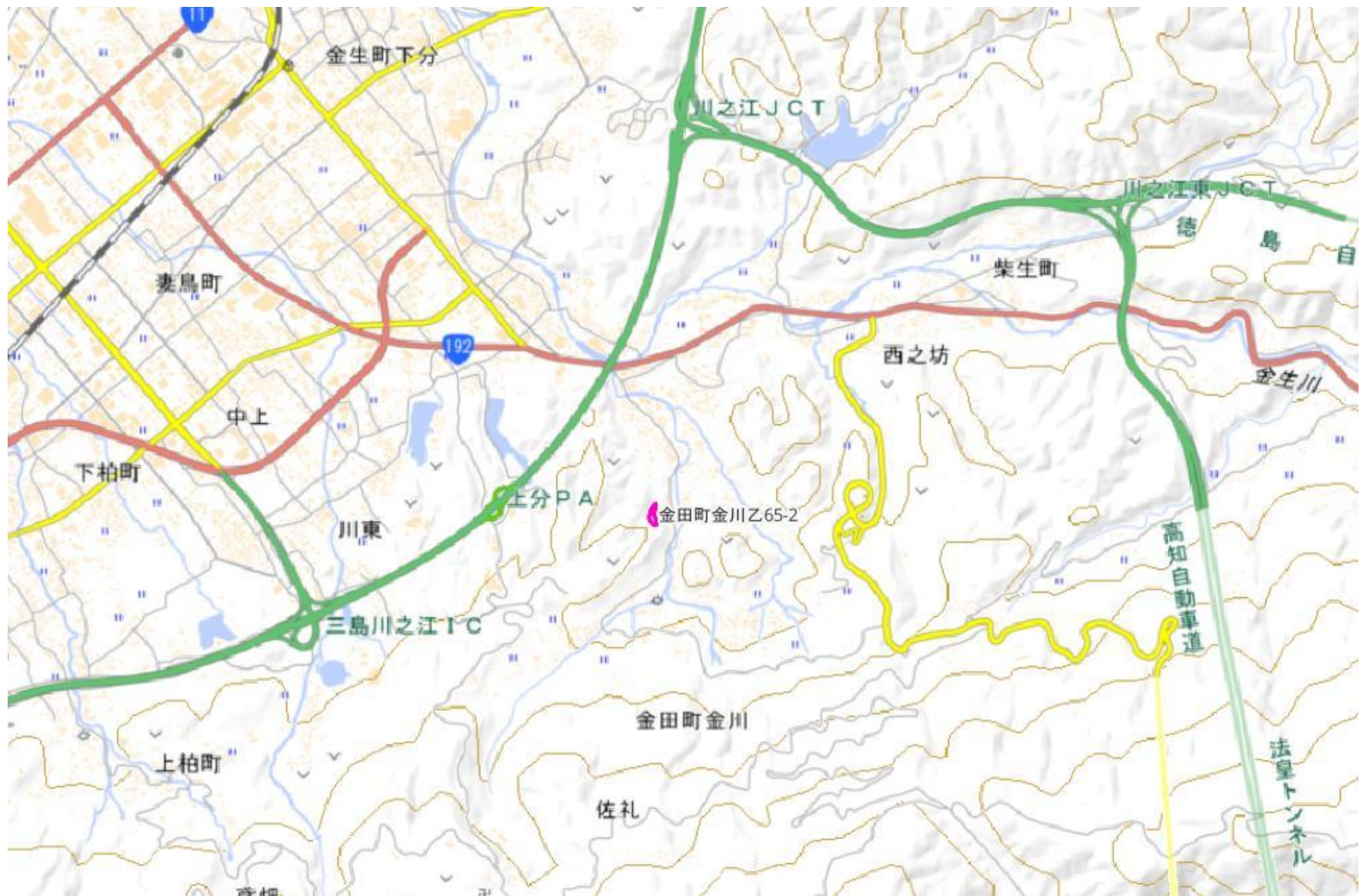
甲が経営管理を委託する意思を表示した森林の広域図