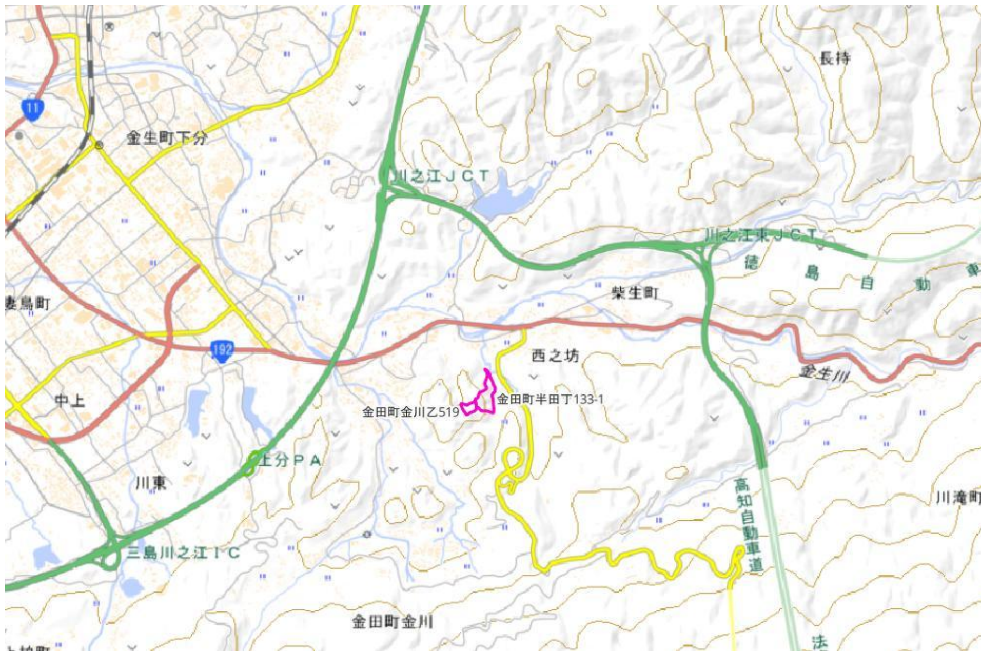
甲が経営管理を委託する意思を表示した森林の広域図