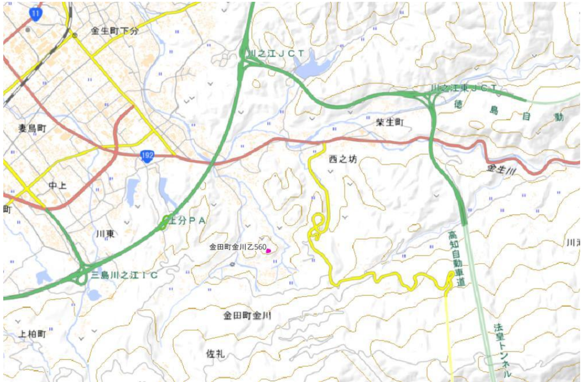
甲が経営管理を委託する意思を表示した森林の広域図