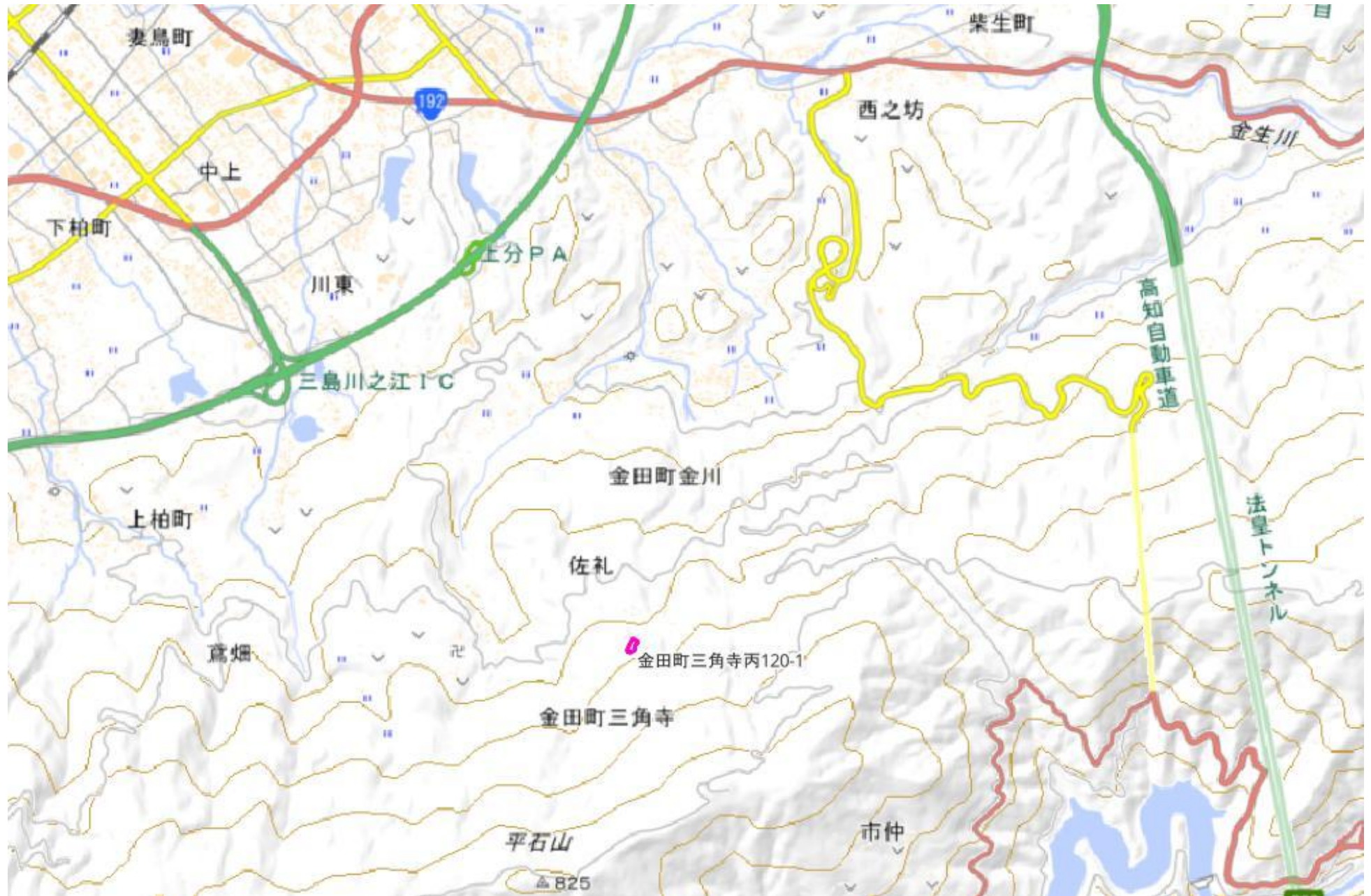
甲が経営管理を委託する意思を表示した森林の広域図