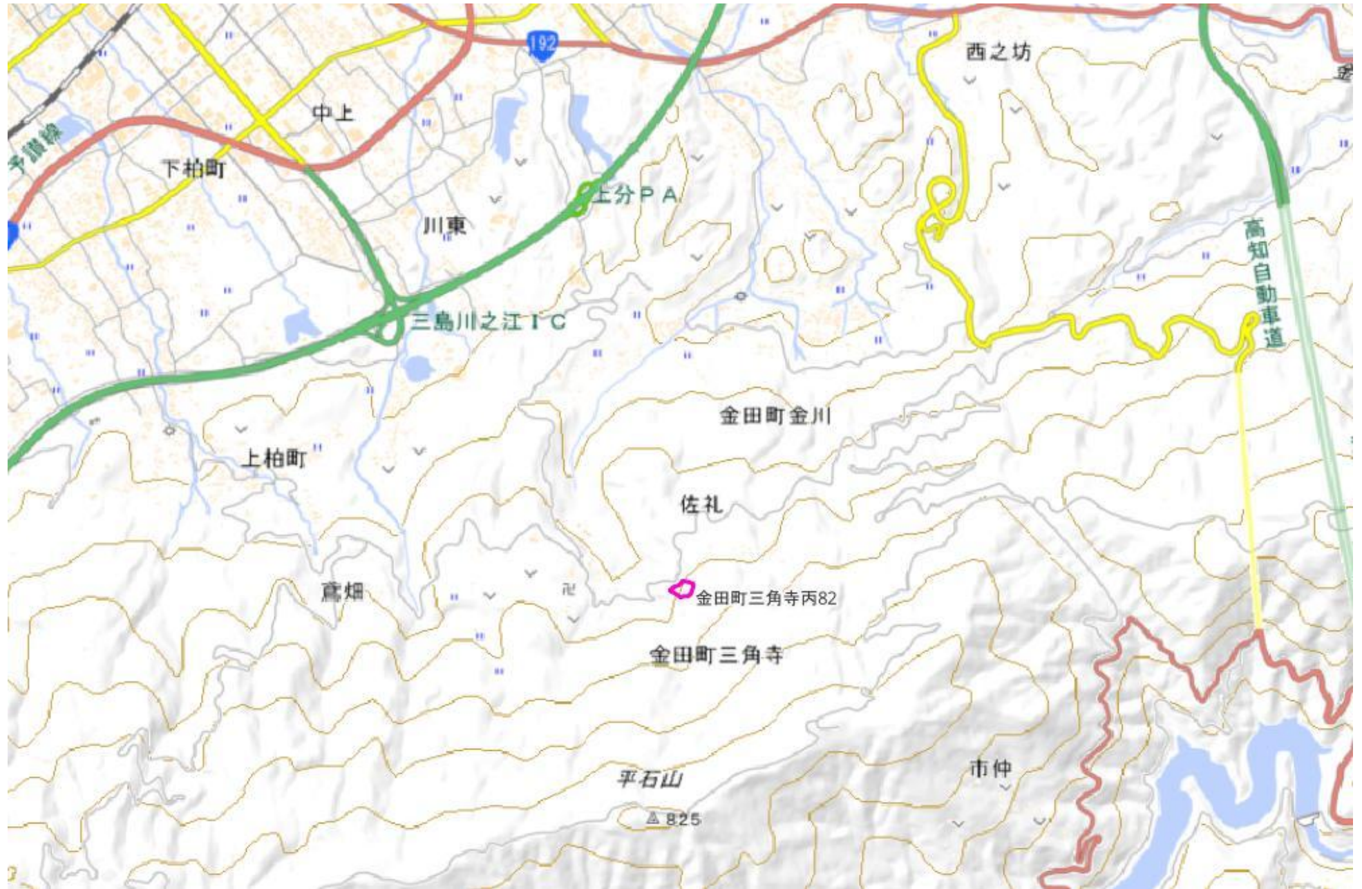
甲が経営管理を委託する意思を表示した森林の広域図