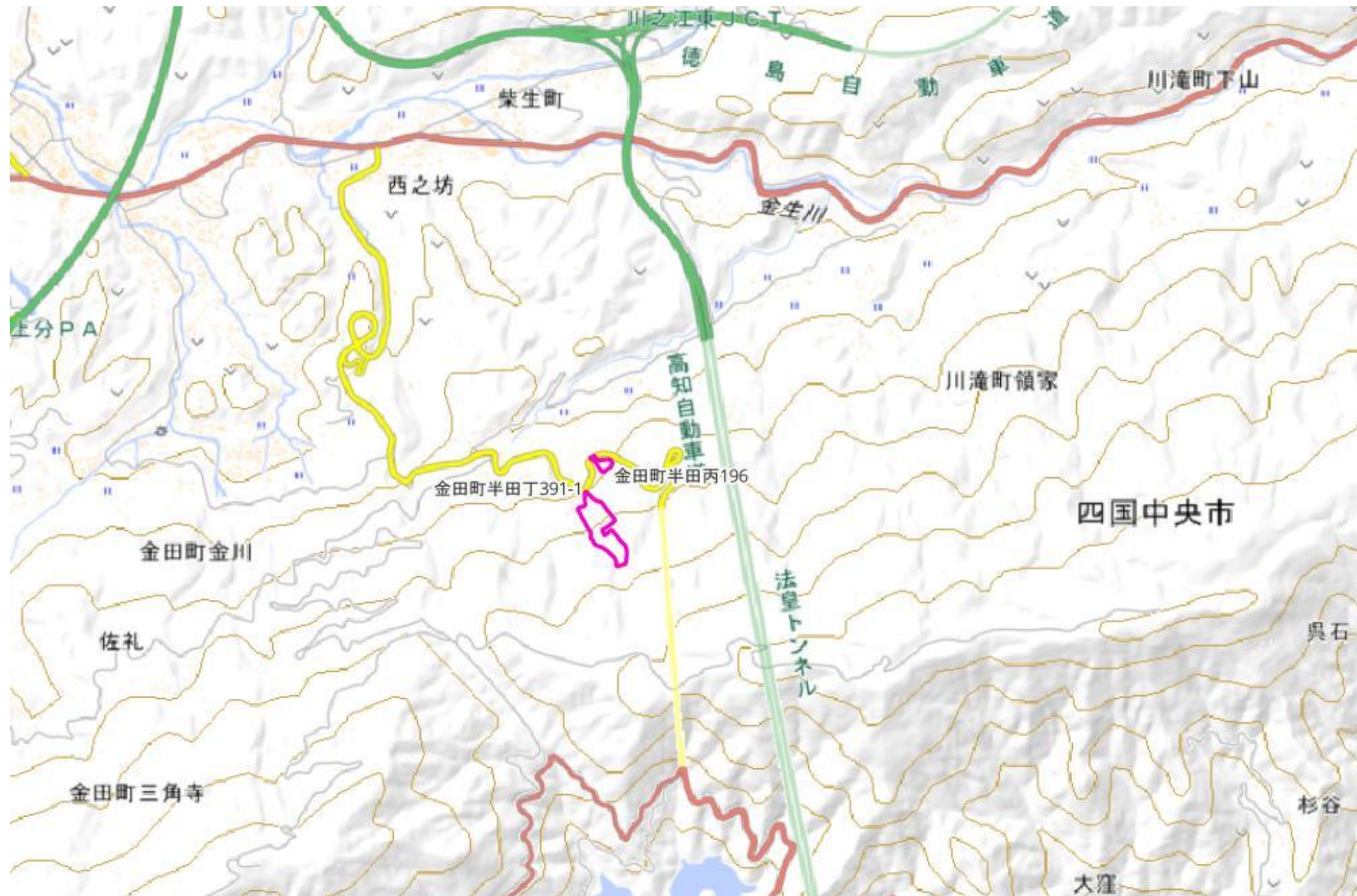
甲が経営管理を委託する意思を表示した森林の広域図