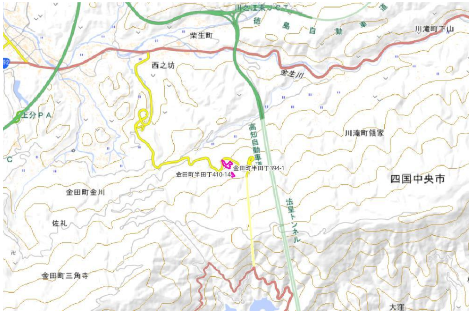
甲が経営管理を委託する意思を表示した森林の広域図