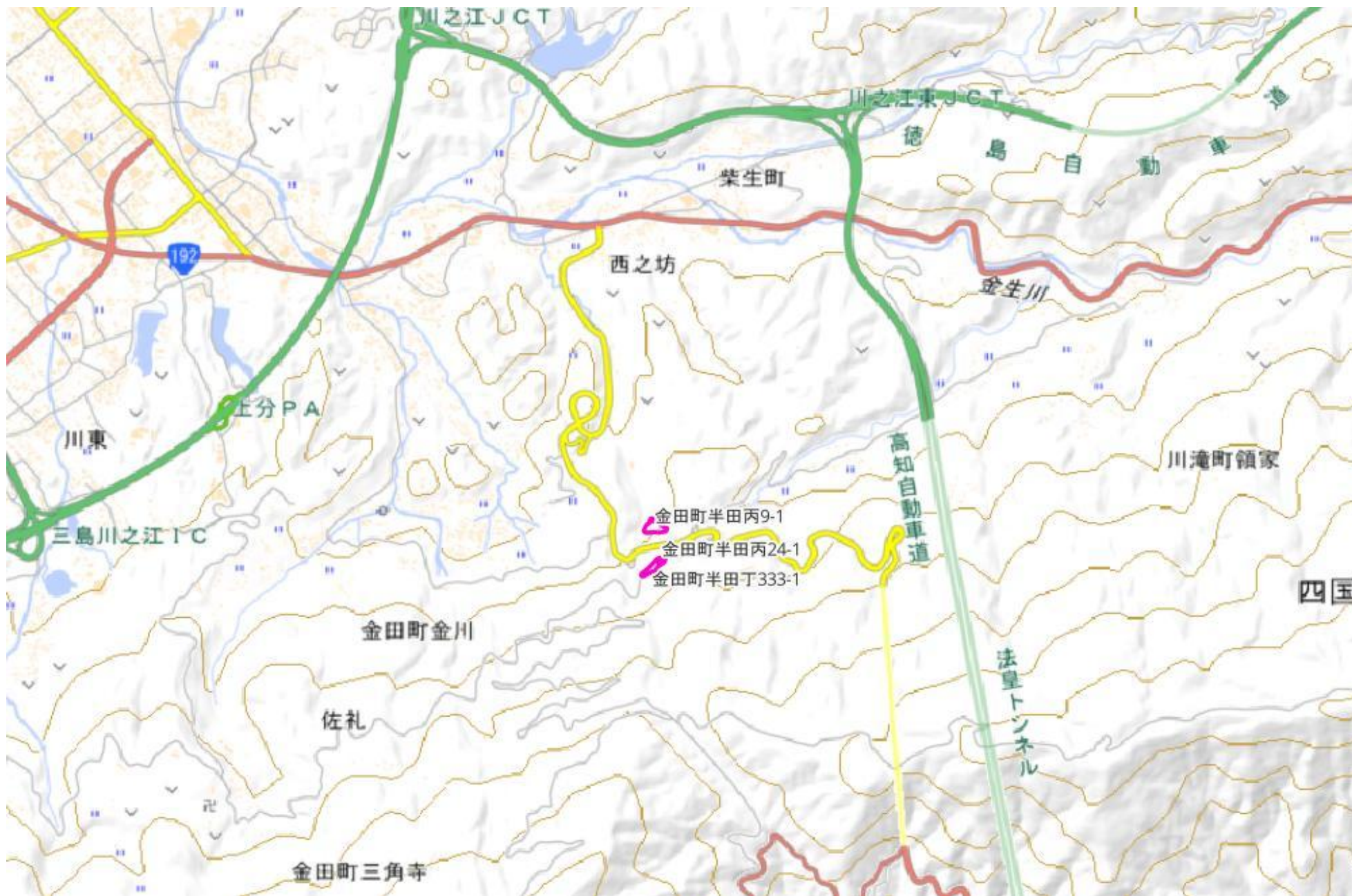
甲が経営管理を委託する意思を表示した森林の広域図