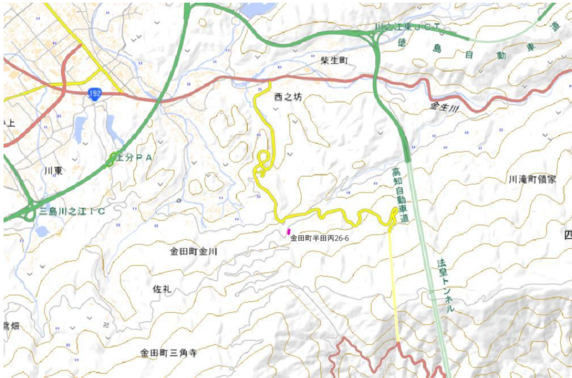
甲が経営管理を委託する意思を表示した森林の広域図