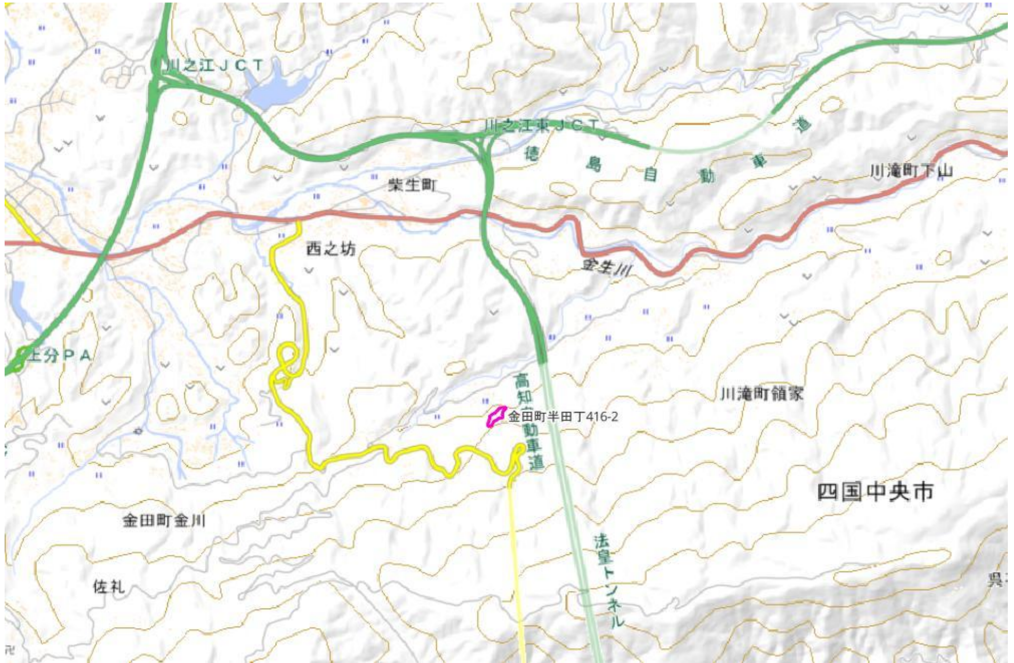
甲が経営管理を委託する意思を表示した森林の広域図