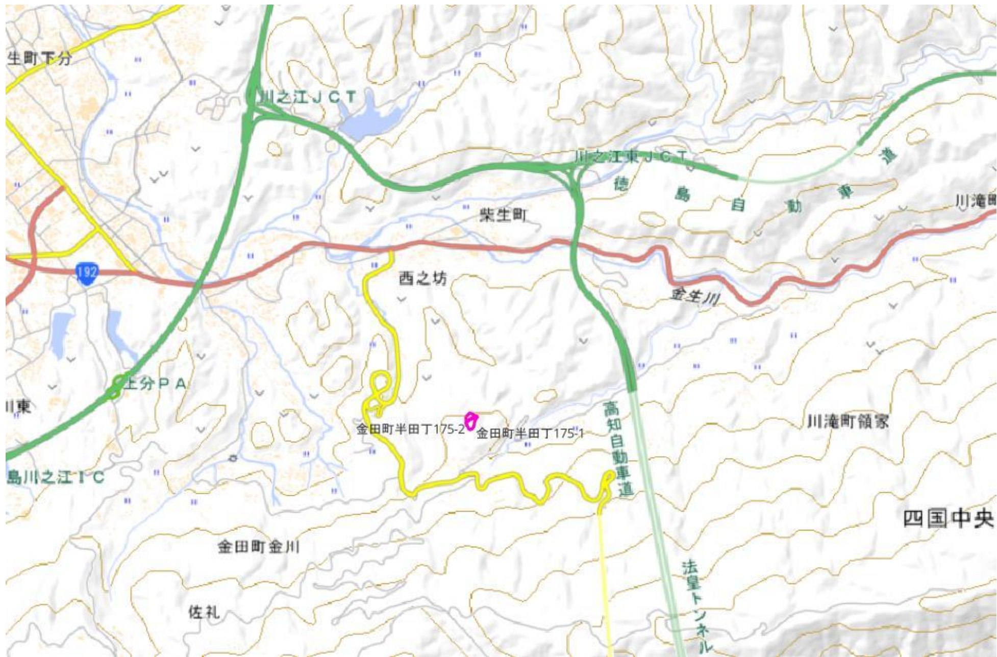
甲が経営管理を委託する意思を表示した森林の広域図