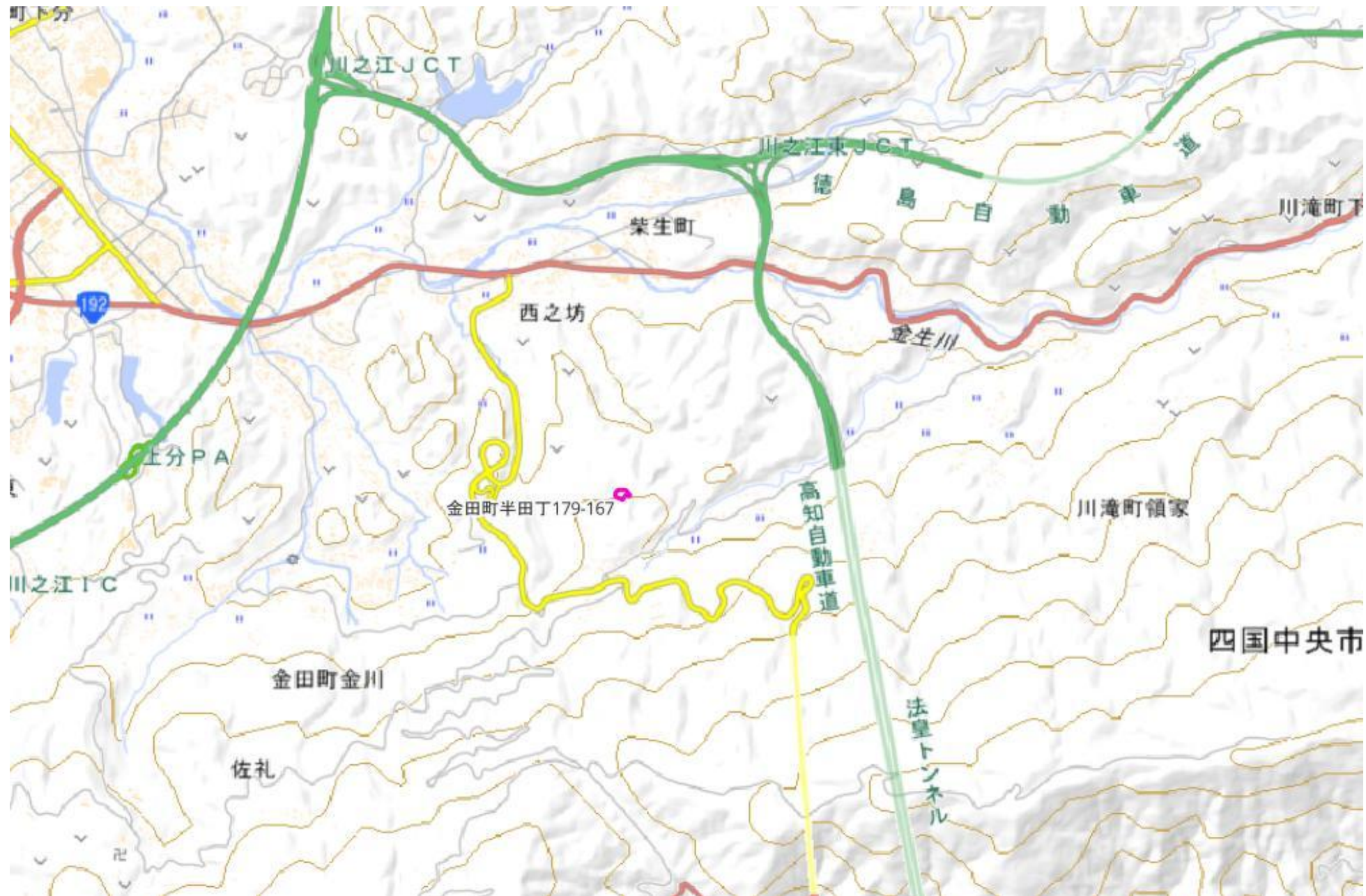
甲が経営管理を委託する意思を表示した森林の広域図