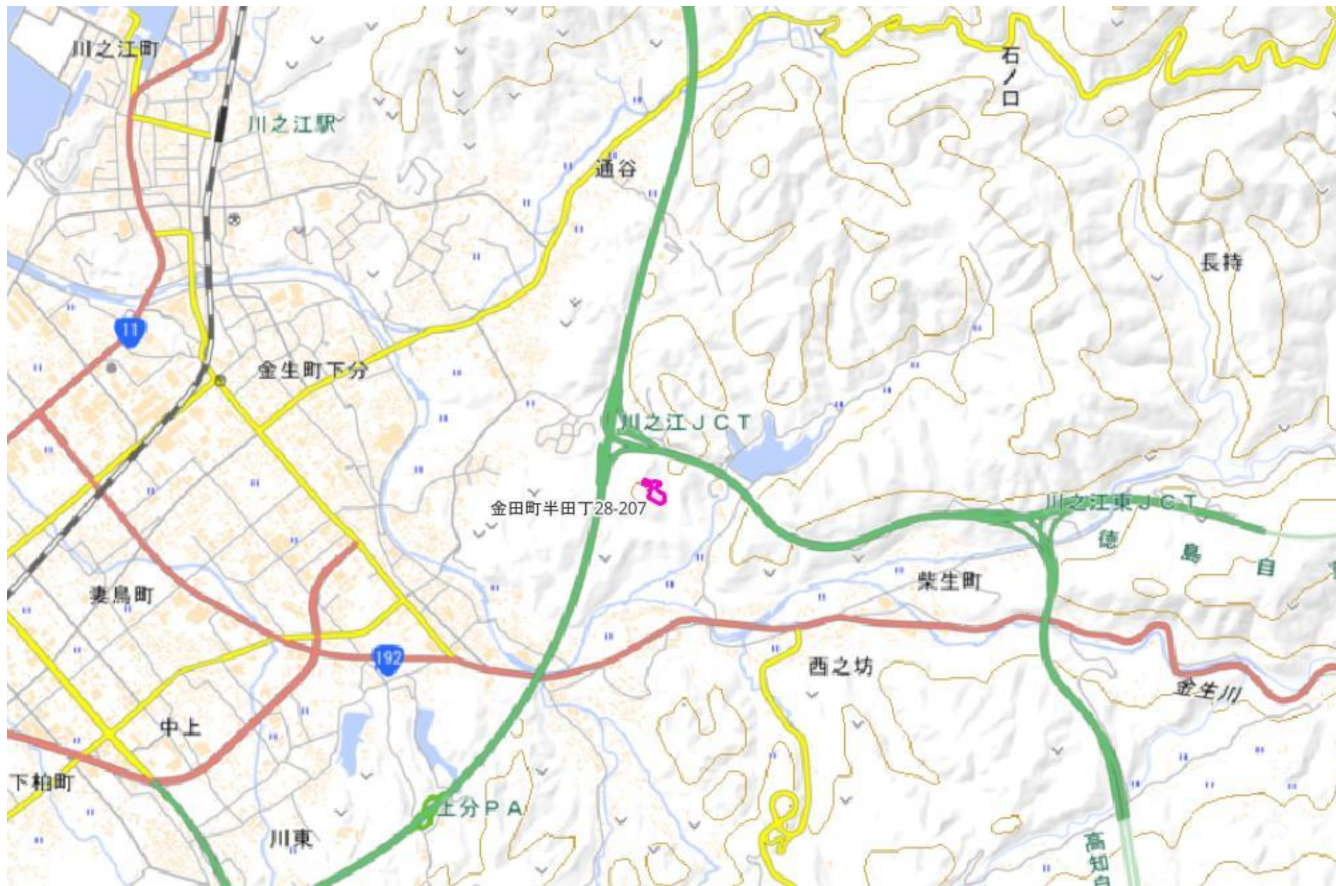
甲が経営管理を委託する意思を表示した森林の広域図