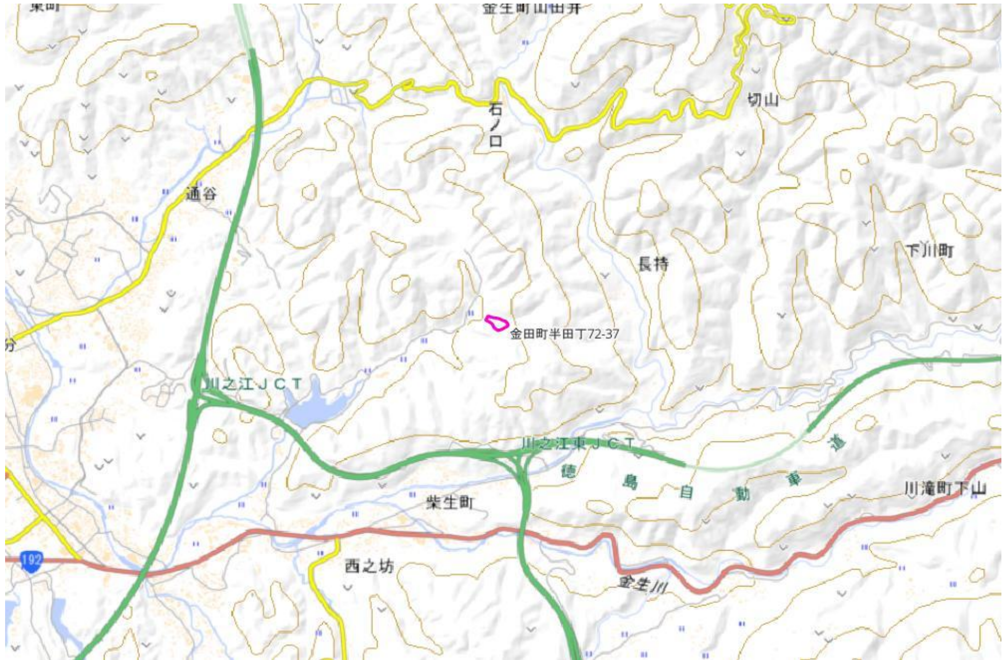
甲が経営管理を委託する意思を表示した森林の広域図