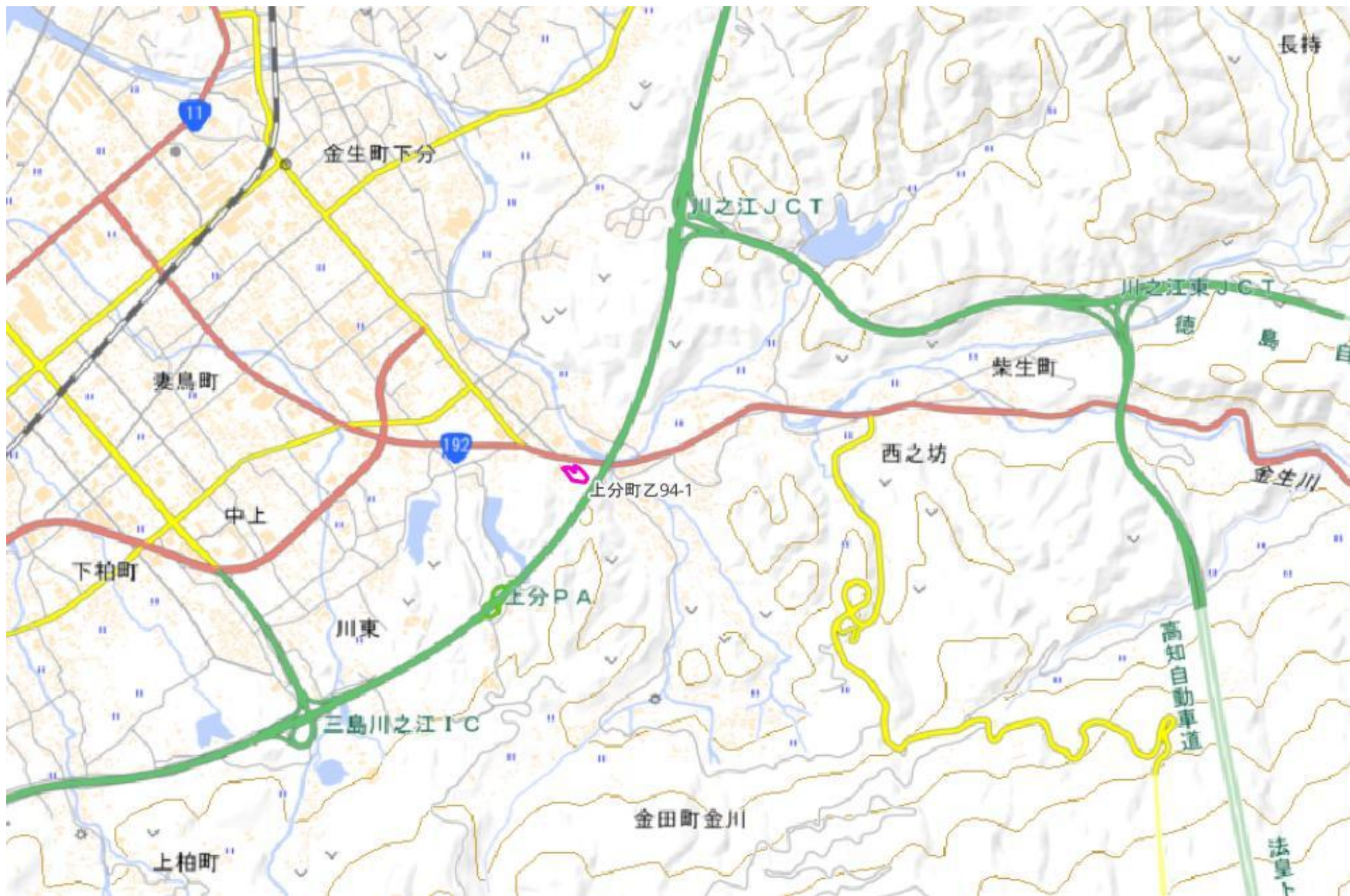
甲が経営管理を委託する意思を表示した森林の広域図