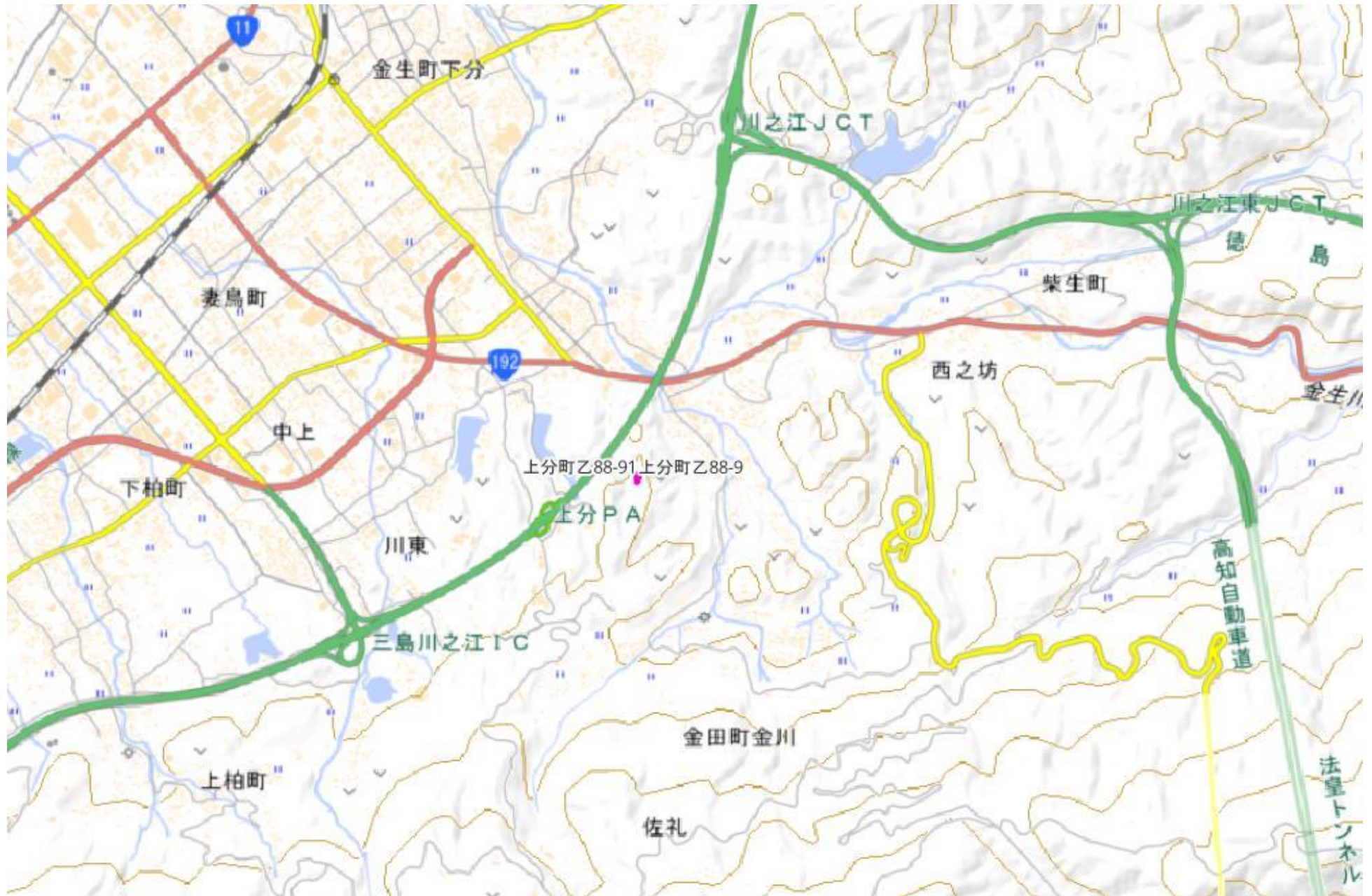
甲が経営管理を委託する意思を表示した森林の広域図