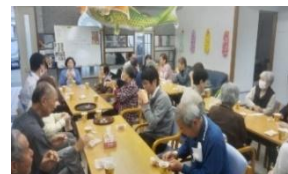
ビンゴや歌や講座など♪